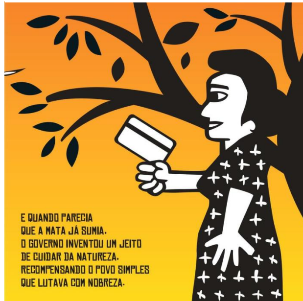
Figura 3. A mulher como “guardiã da floresta”