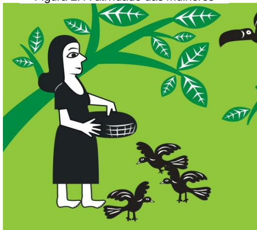
Figura 2. A atividade das mulheres

manutenção familiar. Ao passo que personagens masculinos exibem atividades econômicas, como a extração, sendo aqueles que se deslocam para além do domínio pessoal e por isso, socialmente mais valorizados.